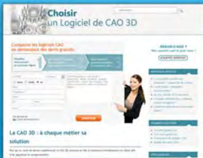
Infopro Communication Contenu web pour de la redirection de lead