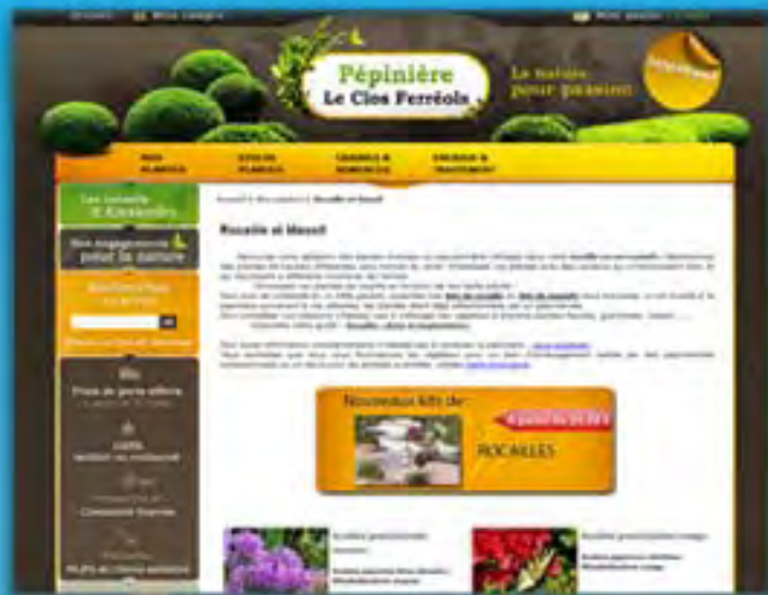
La Pépinière LCF Rédaction de fiches produits