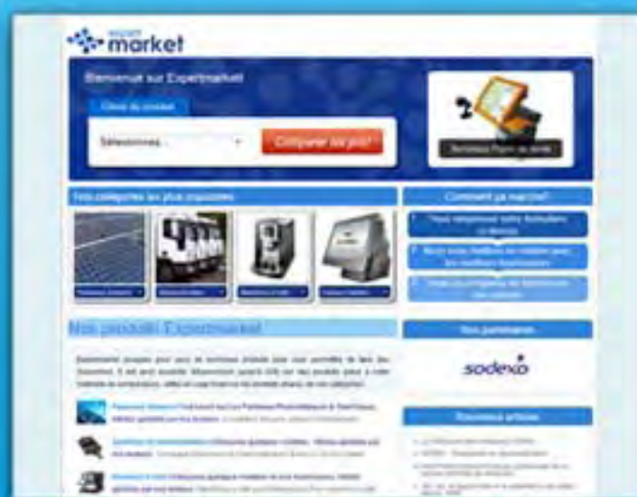
Expert Market Contenu web pour de la redirection de lead