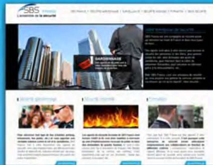
SBS France Rédaction du contenu et refonte graphique